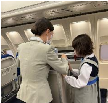
キッザニアにて・・・ CAです!