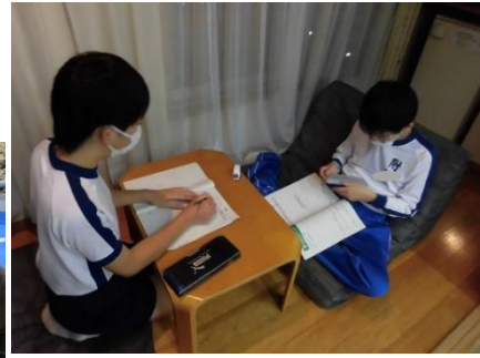
ホテルで今日の振り返り