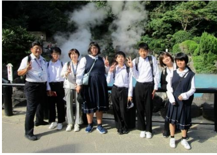
別府地獄めぐり よく歩きました