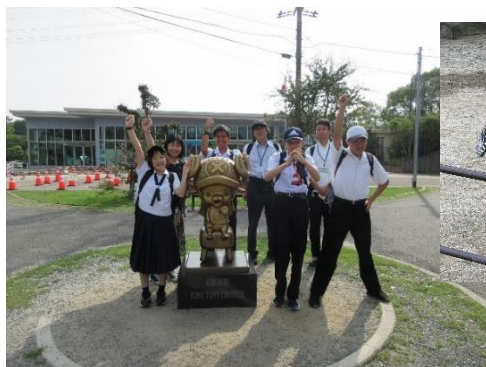
熊本市動物園 動物との距離が近い!

高等部2年生は、2泊3日の修学旅行で熊本方面に行きました。それぞれの見学先でしっかりと学習をしてきました。