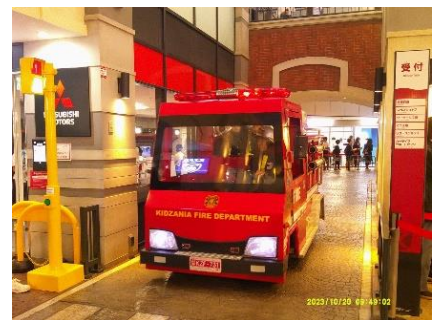
消防士になって消火活動!