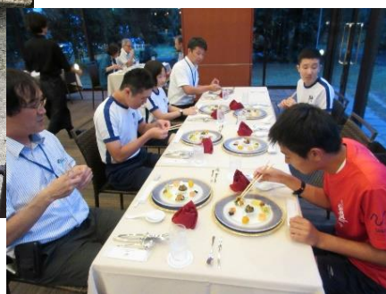
ホテルでの食事 ちょっと緊張