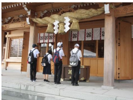
震災からの復興 阿蘇神社・熊本城