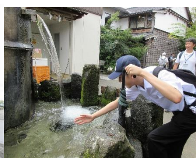
熊本と言えば湧水