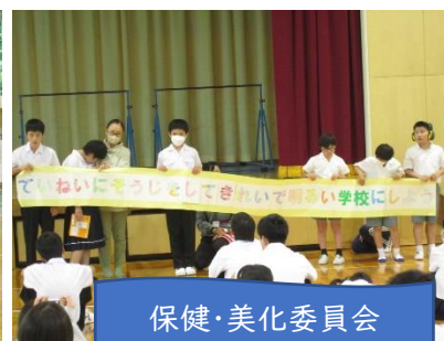
保健・美化委員会