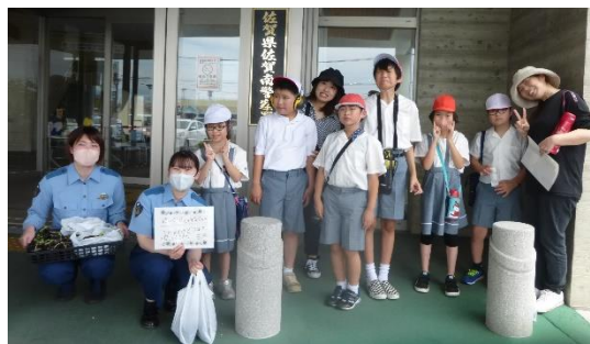
C組 佐賀南警察署へ